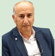
عه بدولره حمان بامه رنی