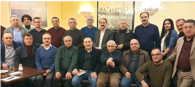
جقاتا ره وشه نبیریا ئازاد ل به رلین

سمیناره کی بۆ مه پیشکیش بکه ت و ژوری به یته، ئه م خوارن و فه خوارین وی دمه زخین، لئ ژیه رکو بتنی داهاتی مه ئابوونه، ئه م نه شیئ مه زاختیب ریکن ب ستوخوه بگرن، ئه گه ر که سه ک ژوری به یته». سه به اره ت گرنگیا فئ جقاتئ، تاریق حه سو گوئ: «ئه ف جقاته بۆ مه گه له ک یا گرنگه، ره وشه نبیرین